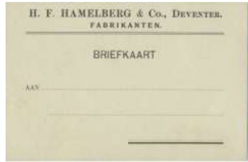
[Diverse foto's materiaal Hamelberg & Co., o.a. een prijscourant uit 1895]